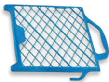
Plastová stírací mřížka 27 x 29 cm