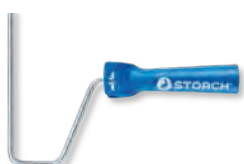
Držák válečků 10 - 18 - 25 cm