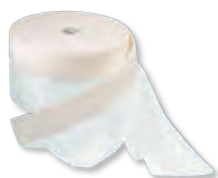
CoverMask fólie 55 cm x 33 m 140 cm x 33m 210 cm x 20 m 270 cm x 16 m