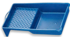
Plastová vanička na barvu 14 x 29 - 34 x 50 cm