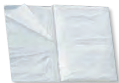
Fólie zakrývací LDPE 4 x 5 m - 0,018 mm